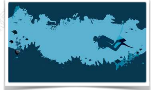
CARETEO Y BUCEO