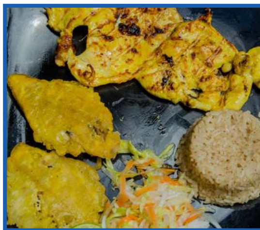
POLLO A LA PLANCHA