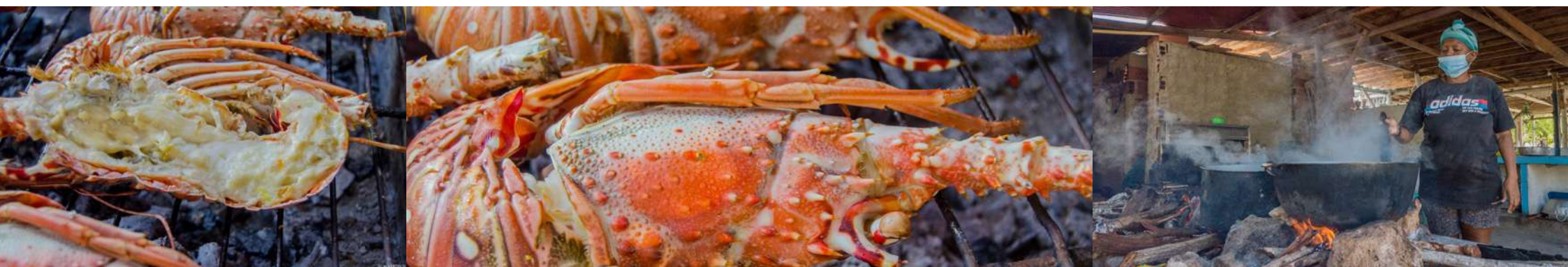
TRADICIONAL LANGOSTA A LA BRASA