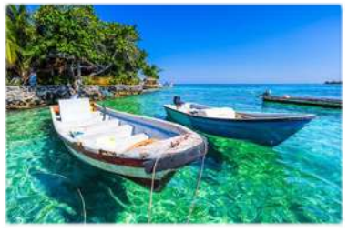
NAVEGACION Y PESCA